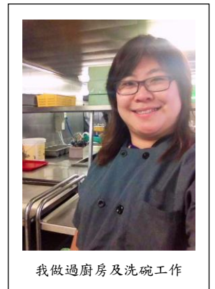
我做過廚房及洗碗工作

說實的，疫情一直蔓延，經濟衰退，我告訴大家我沒有擔心生活及財政，一定是欺騙大家吧！相反，我的丈夫在這一年來更經歷凍薪及差點被裁的經歷，現在被裁員的危機仍未解除，故現在我們與很多人一樣每天也戰戰兢兢生活，深感自己是下一個被裁的目標。雖然心理和經濟壓力比以前大了，但或許我們亦曾有金融海嘯時被裁員的經驗，心態反沒以前那般沈重，還有從上主而來喜樂的心作預備，我曾問他如果工作真是沒有了，你會怎樣呢？他告訴我已有作「步兵」(外賣員)的打算，並且開始預備找新工作及了解作外賣員的準備。